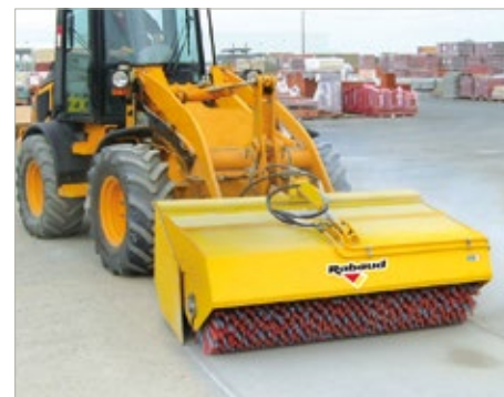
Adaptation sur chargeuse