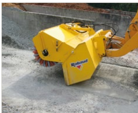
En marche avant : utilisation du godet avec balai relevé pour dégrossir ou charger.