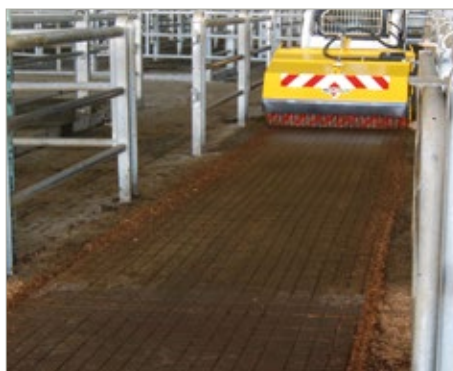
En marche arrière : balai baissé pour finition et balayage avec remplissage du godet.