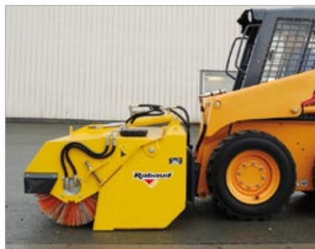
Adaptation sur chargeur compact