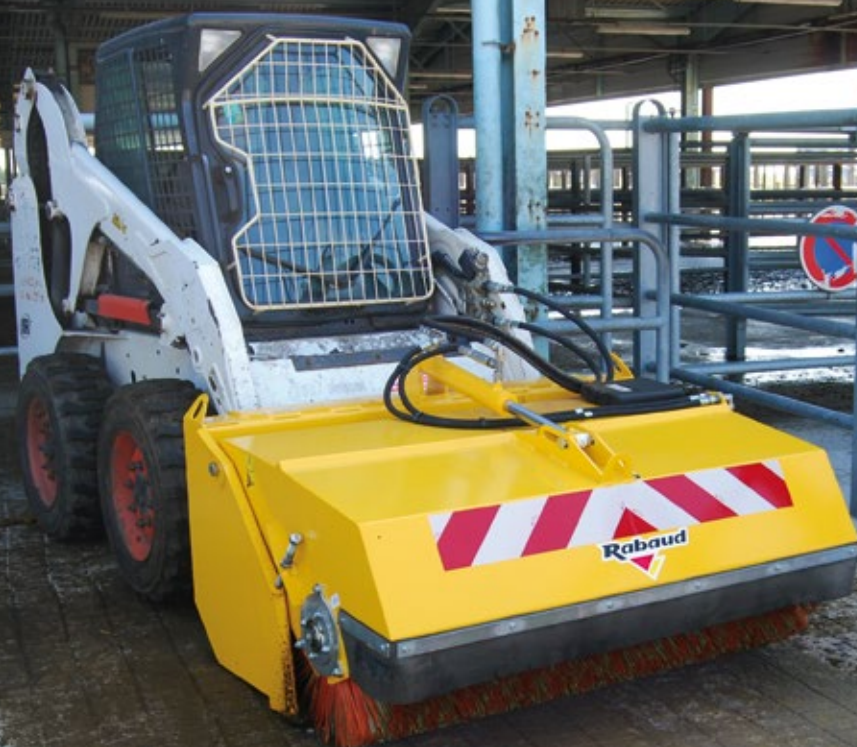
GODET BALAYEUR 1500 sur chargeur compact

Double fonction : ce godet balayeur permet de balayer/ramasser ou de faire les travaux de manutention.