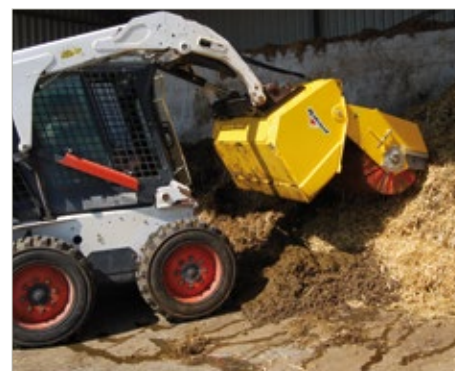
Vidange du bac par vérin hydraulique