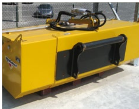
Attache porteur à définir : ci-dessus une attache pour télescopique